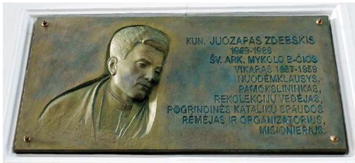
Atminimo lenta Šv. Mykolo Arkangelo (Igulos) bažnyčioje.