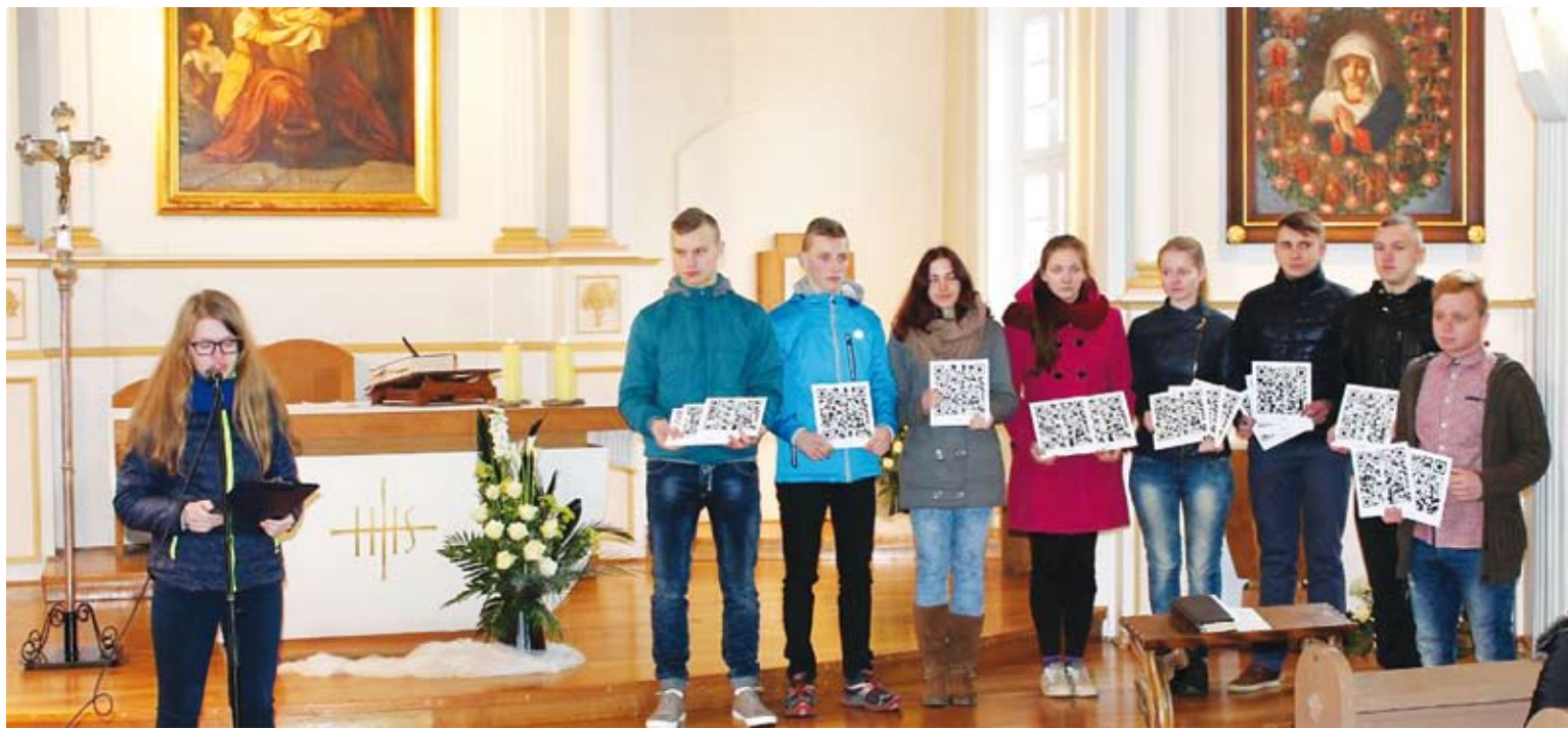
Interaktyvaus projekto įgyvendinimo komanda.

– Taip, jūs teisius. Sukvietėme visą mokyklos bendruomenę Valstybės atkūrimo proga pasimelsti už tai, kas mus vienija. O mus vienija tikėjimas. Todėl ir tinkamiausia tam vieta – mūsų dvasinės stiprybės